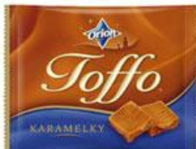
Slavie, Beskydky, Toffo